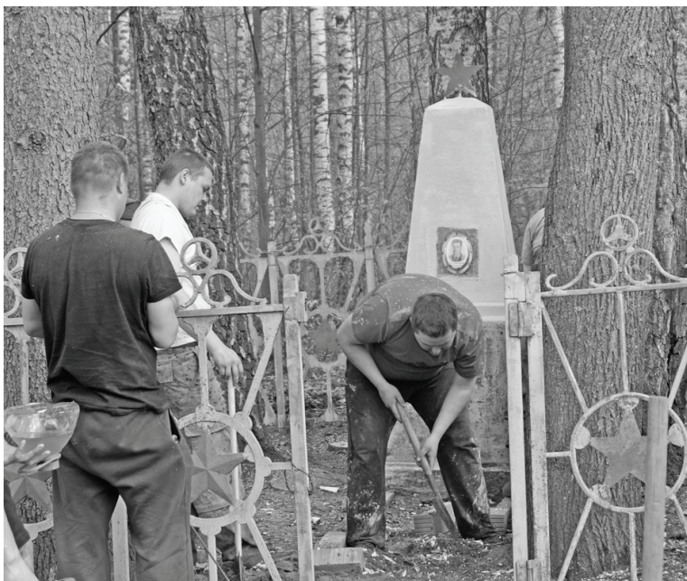
Участники акции привели в порядок памятники в Ливадии и Хлудневе.

мятников. Народ поделился на 2 группы, которые выдвинулись автоколоннами каждая к своему месту назначения. Экипажи «стандарт», как их называют между собой бывалые, направились в деревню Хлуднево. Им предстояло восстановить памятный знак на месте боя чекистов-лыжников. А внедорожники поехали в Ливадию, к памятнику разведчику старшему лейтенанту Глебу Данилову, павшему здесь смертью храбрых.