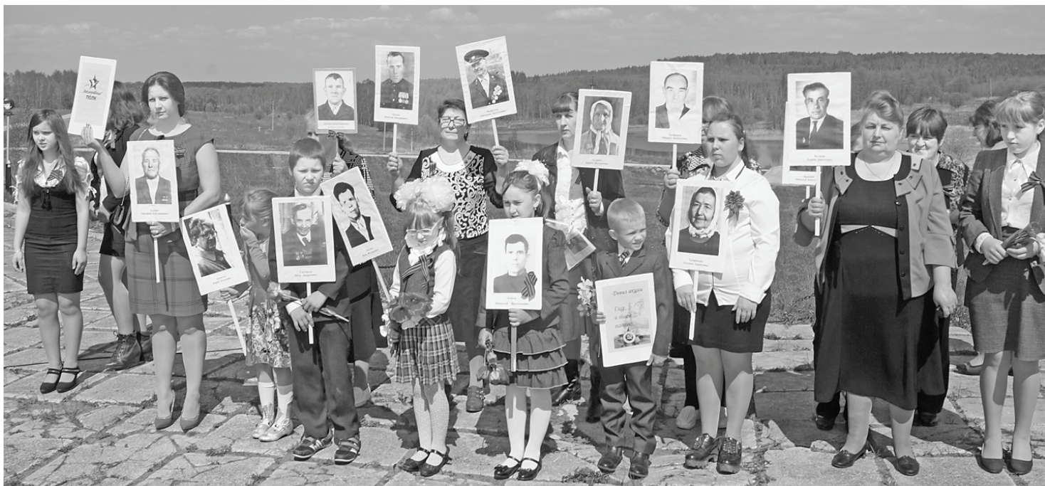
«Бессмертный полк» Котори и Хлуднево.