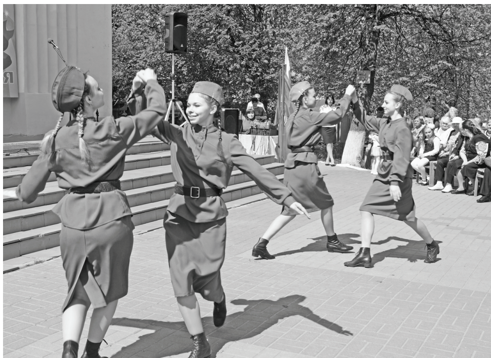
Праздничный концерт пришелся зрителям по душе.

Это красивое и яркое зрелище — подарок думиничанам от предпринимательского сообщества поселка, станции и деревни Думиничи, от наших предприятий — хлебокомбината и мясокомбината, ООО «Агроснаб-Калуга», магазинов «Дикси», «Пятерочка» и «Магнит».