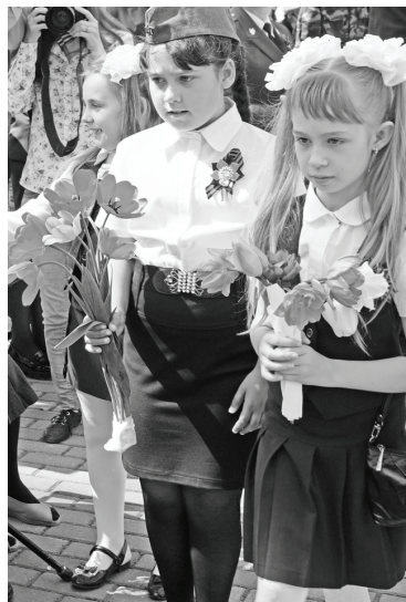
Юные думиничане: гордимся, помним, благодарим!