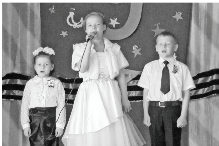
Концерт в Дубровке.