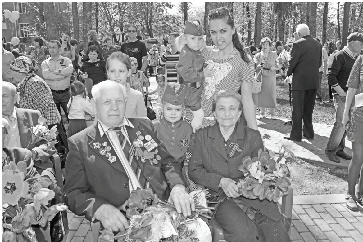
Семья Хрыченковых и Сидоровых: «Спасибо за Победу бабушке и деду!»