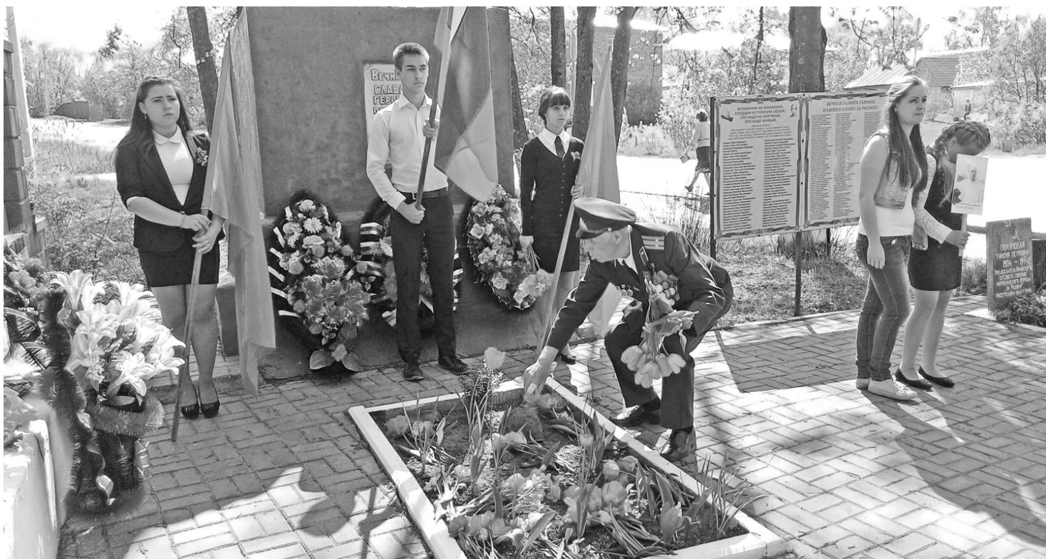
Мемориал памяти в Брыни.

В праздничном концерте «Неугасима память поколений» приняли участие воспитанники Брынского детского сада «Сказка» и учащиеся школы. Зал нашего СДК был полон народа. Патриотические песни нашли искренний отклик в сердцах людей, многие исполнители пели вместе со зрителями.