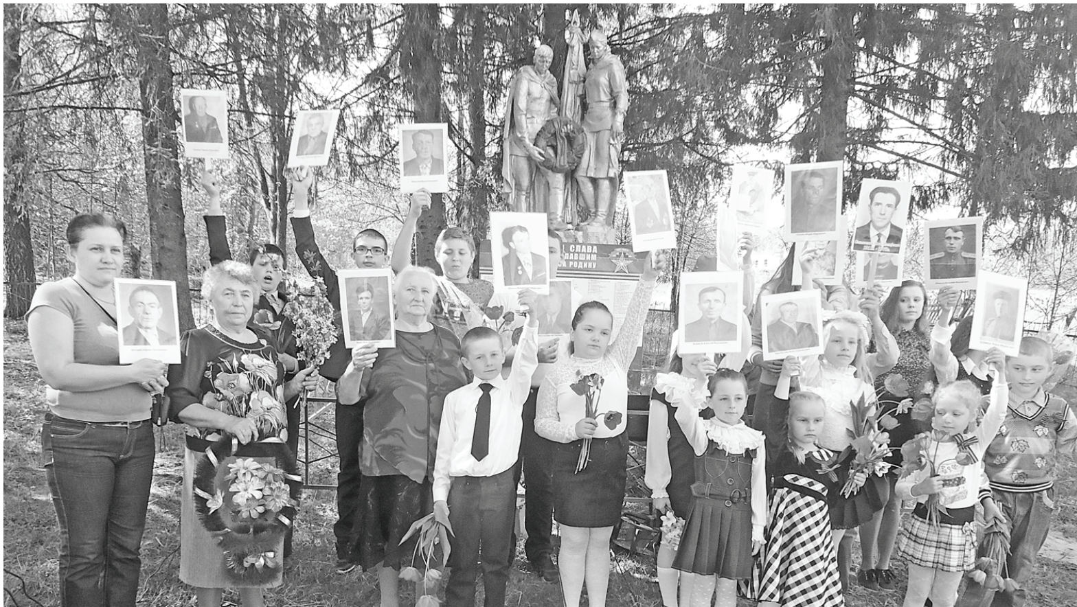
На митинге в Сяглове.