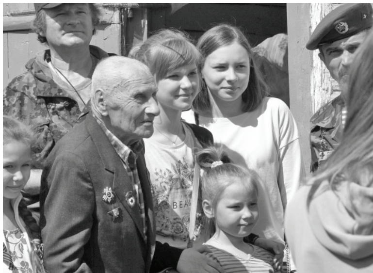
С праздником, дорогие наши ветераны!