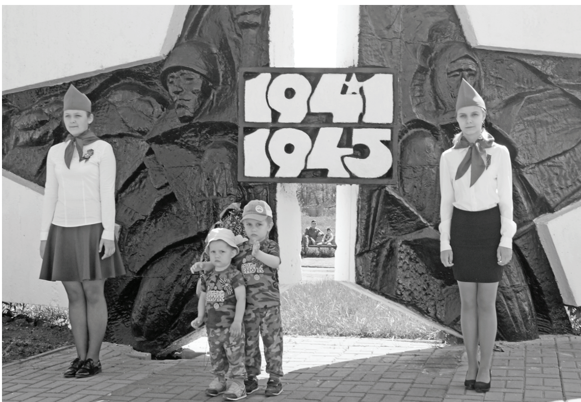
В Почётном карауле - правнуки Победы.

Это было очень трогательное мероприятие, собравшее много народу и врезавшееся в душу стихотворениями, песнями, кадрами видеофильма, продемонстрированного на большом экране, установленном под открытым небом.