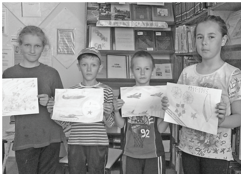
Праздник в Вёртном.